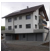
Neubau Hans Bauernhaus in Sempach