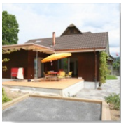
Umbau Ferienhaus am Vierwaldstättersee in Merlischachen | *