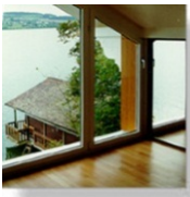
Sanierung / Renovation Einfamilienhaus in Eich