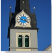
Fassadensanierung Pfarrkirche Eich