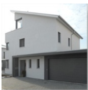
Neubau Einfamilienhaus Röschmatte in Sempach MINERGIE®