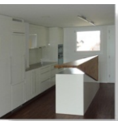
Umbau Wohnung in Sempach