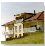
Neubau 3-Familienhaus in Eich